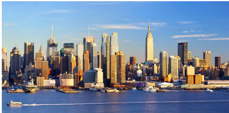
ניו יורק

"מדובר בבשורה דרמטית למשק הישראלי וליזמים ואנשי עסקים שעד כה נמנעה מהם האפשרות לפעול באופן חופשי בארצות הברית", כך הגדיר עו"ד צבי קן-תור, יו"ר ועדת אשרות בלשכת מסחר ישראל-אמריקה את מהלך פתיחת קטגוריית האשרות E2 בפני חברות ישראליות - מהלך שקידם בעשר השנים האחרונות ושנכנס לתוקפו השבוע.